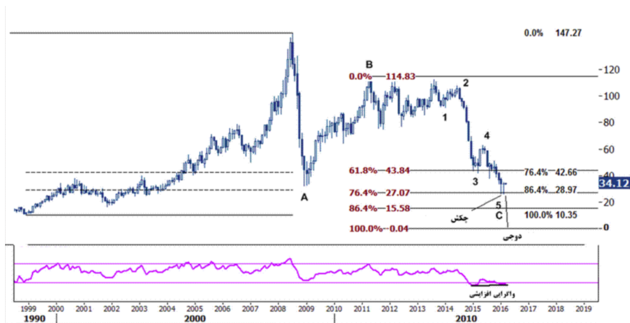
نمودار روند تغییرات تایم فریم روزانه قیمت نفت خام سبک آمریکا