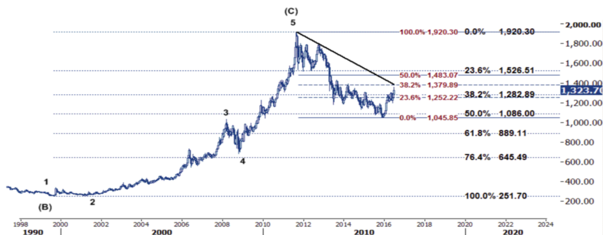
نمودار روند تغییرات تایم فریم روزانه قیمت جهانی اونس طلا