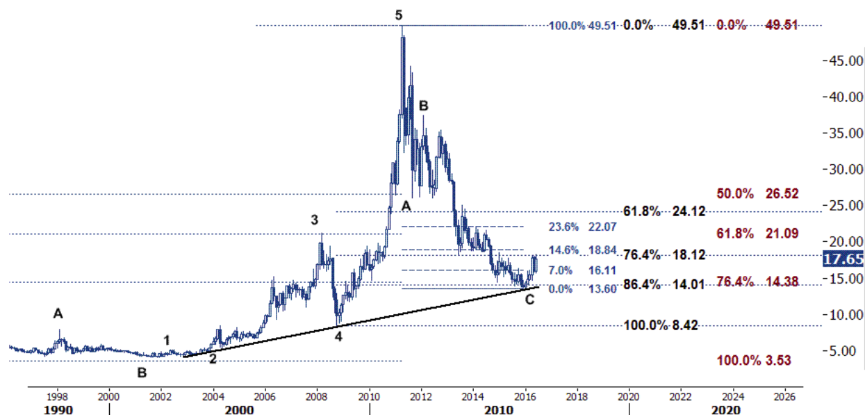
نمودار روند تغییرات تایم فریم روزانه قیمت جهانی اونس نقره