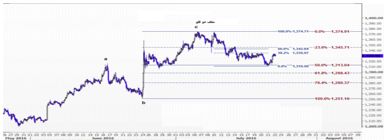
نمودار روند تغییرات تایم فریم ۱ ساعته قیمت جهانی اونس طلا