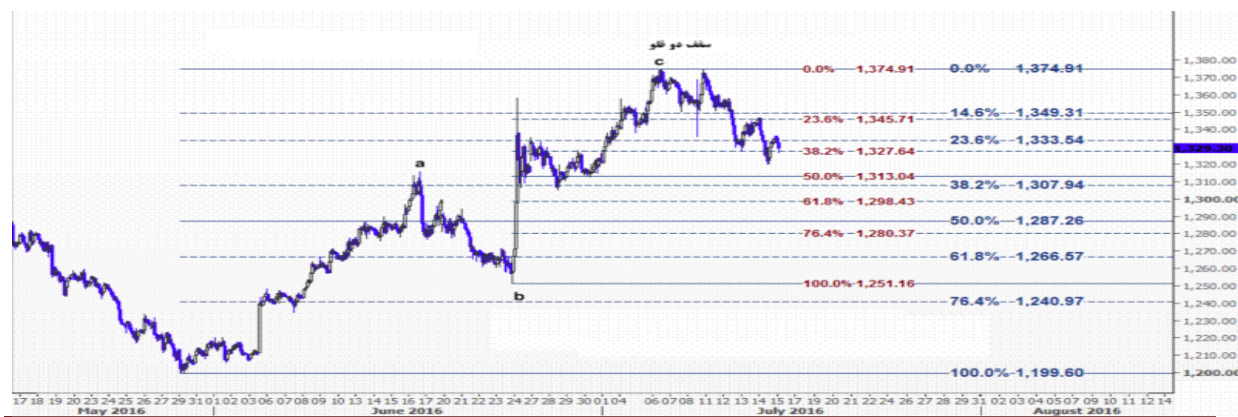
نمودار روند تغییرات تایم فریم ۱ ساعته قیمت جهانی اونس طلا