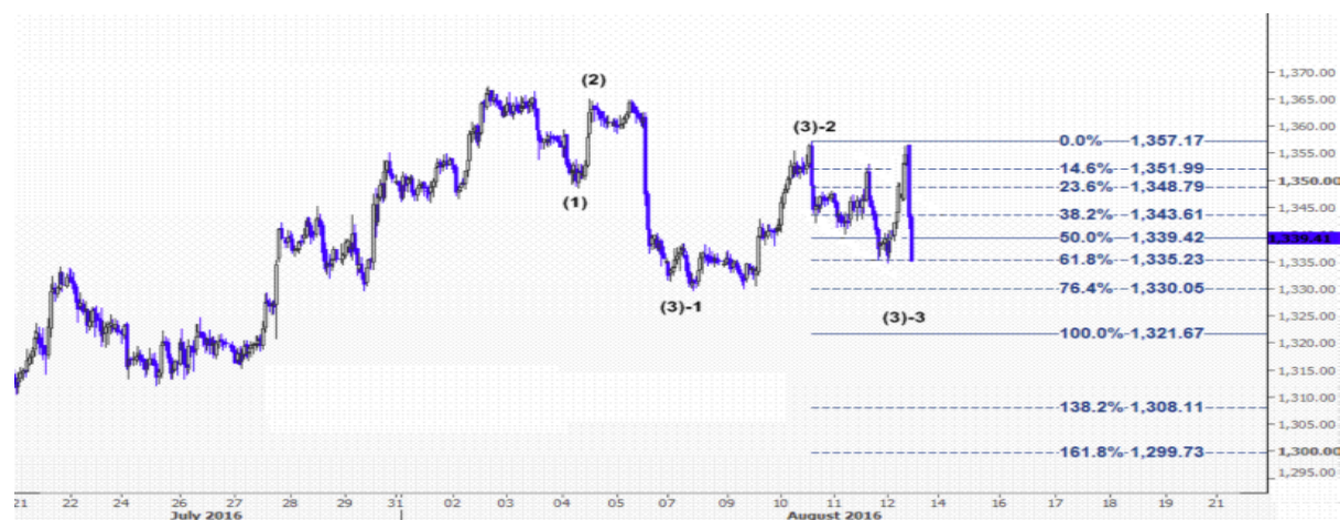
نمودار روند تغییرات تایم فریم ۱ ساعته قیمت جهانی اونس طلا