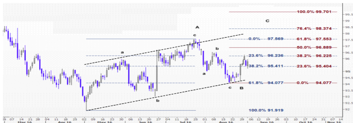
نمودار روند تغییرات تایم فریم روزانه قیمت جهانی شاخص دلار آمریکا

برای شاخص جهانی ایندکس دلار آمریکا (DXY) که ارزش آن را در برابر پایه سیدی متشکل از ارزهای عمده بازار اندازه گیری می کند، یورو، ین ژاپن، دلار کانادا، پوند انگلیس، کرون نروژ و فرانک سوئیس در حال حاضر شش ارز عمده تشکیل دهنده سبد مذکور هستند، پیش بینی می کنیم قیمت آن به سوی سطح مقاومت ۹۶.۲۲ و ۹۶.۲۳ صعود کند که این حرکت افزایشی را تثبیت قیمت بالای سطح حمایت ۹۵.۴۱ در نمودار پایین به وضوح نشان داده است. این سطح حمایت بر روی خط فیبوناچی ۳۸.۲ درصدی از موج افزایشی ۹۱.۹۱۹ (پایین ترین سطح ۳ مه) به ۹۷.۵۶۹ (بالاترین سطح ۲۵ جولای) تشکیل شده است و چنانچه در هفته جاری سطوح مقاومت ۹۶.۲۲ و ۹۶.۲۳ با قدرت شکسته شود و هدف بعدی بر روی سطح ۹۶.۸۸ (خط فیبوناچی ۵۰ درصدی) می باشد. بررسی امواج الیوت ویو نیز بیانگر آن است که قیمت در موج افزایشی C یعنی سومین موج از چرخه سه موجی از سطح ۹۱.۹۱۹ در حرکت است که در بیشترین قدرت افزایش خود می تواند تا حدود سطح ۹۹.۷۰۱ (خط فیبوناچی ۱۰۰ درصدی) صعود کند و بررسی تحلیل فیبوناچی پروجکشن تارگت قیمت را در سطوح ۹۶.۲۲ و ۹۶.۲۳ و پس از آن سطح ۹۶.۸۸ نشان می دهد که در چارت پایین دیده می شود.