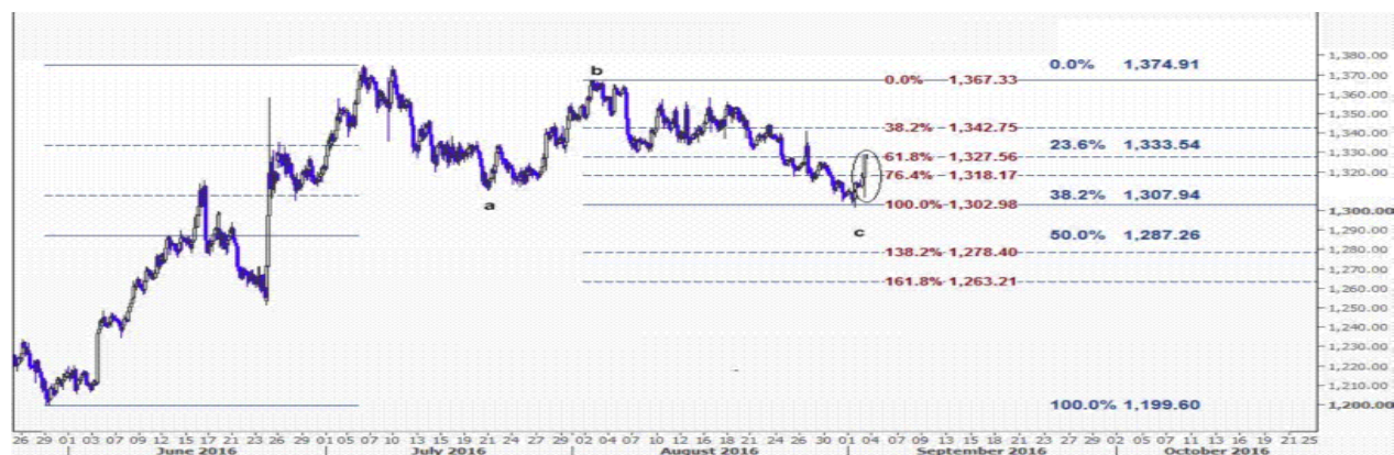
نمودار روند تغییرات تایم فریم ۱ ساعته قیمت جهانی اونس طلا