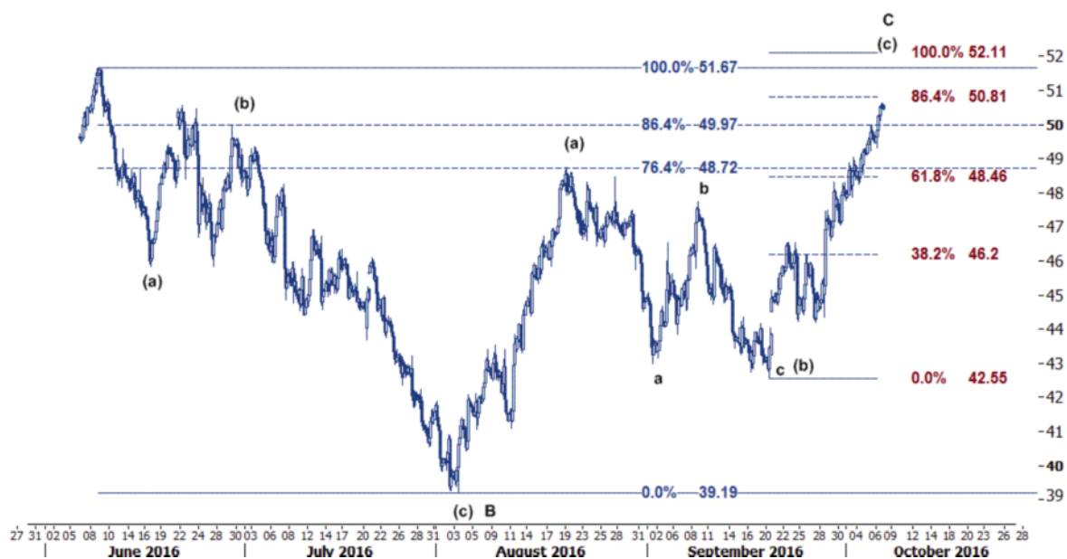
نمودار روند تغییرات تایم فریم ۱ ساعته قیمت نفت برنت دریای شمال بازار لندن