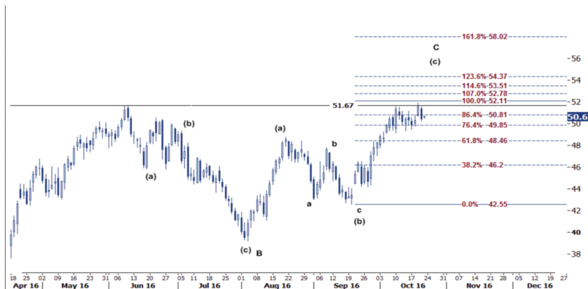
نمودار روند تغییرات تایم فریم روزانه قیمت نفت خام سبک آمریکا