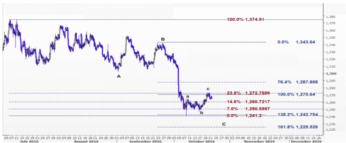
نمودار روند تغییرات تایم فریم ۱ ساعته قیمت جهانی اونس طلا