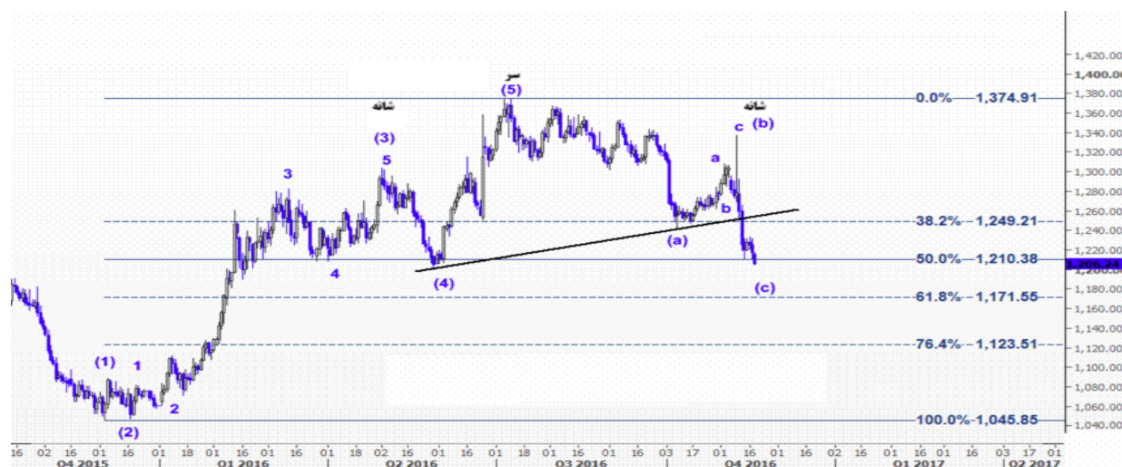
نمودار روند تغییرات تایم فریم روزانه قیمت جهانی اونس طلا

لازم به ذکر است این هفته در تقویم اقتصادی آمریکا به غیر از صورتجلسه نشست پیشین بانک مرکزی آمریکا، فروش خانه های موجود، شاخص سفارشات کالاهای بادوام، آمار بازیابی تمایلات مصرف کنندگان میشیگان و شاخص فروش خانه های نوساز منتشر می‌شوند.