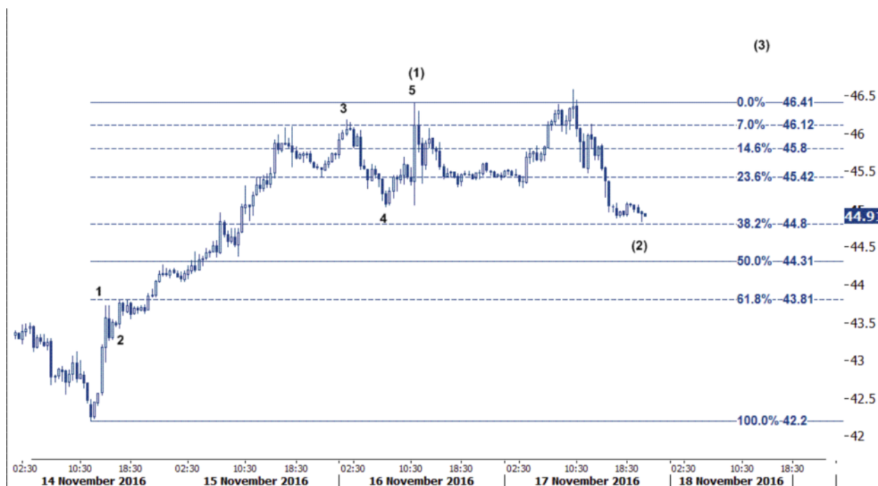
نمودار روند تغییرات تایم فریم ۱ ساعته قیمت نفت برنت دریای شمال بازار لندن