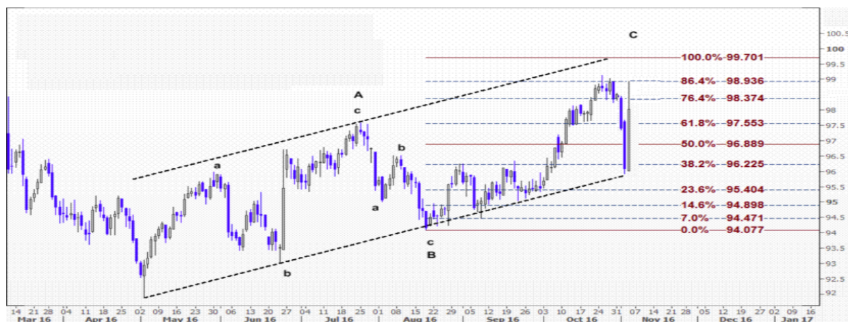
نمودار روند تغییرات تایم فریم روزانه شاخص جهانی ایندکس دلار آمریکا