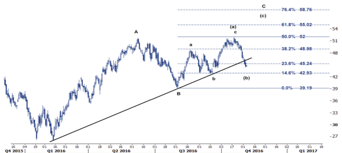
نمودار روند تغییرات تایم فریم روزانه قیمت نفت خام سبک آمریکا