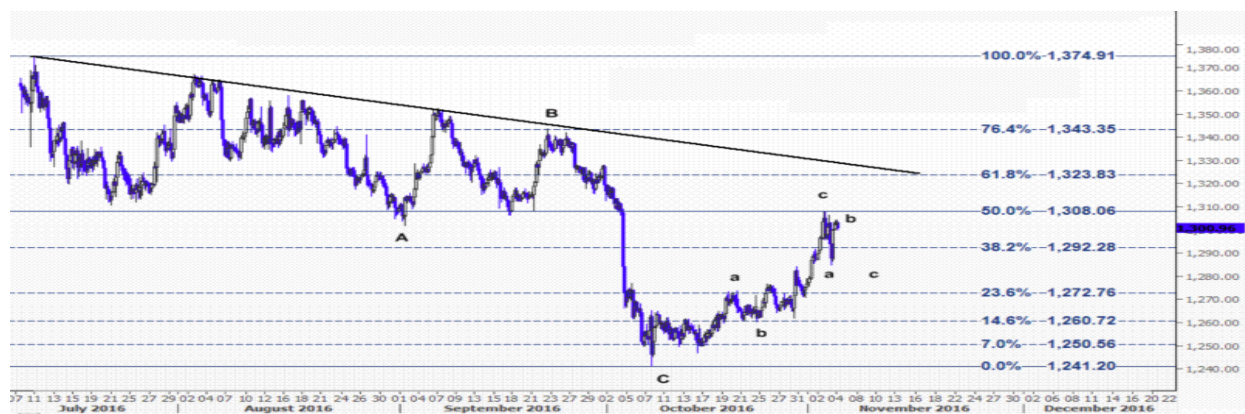
نمودار روند تغییرات تایم فریم ۱ ساعته قیمت جهانی اونس طلا