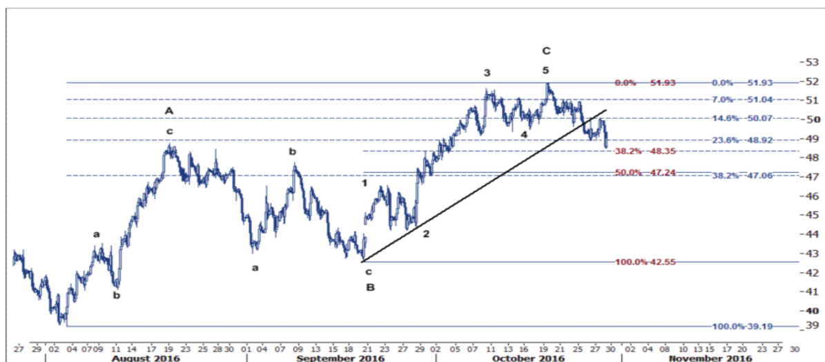
نمودار روند تغییرات تایم فریم ۱ ساعته قیمت نفت خام سبک آمریکا

در حرکت صعودی تنها شکسته شدن سطح مقاومت ۵۰.۸۵ سیگنال خرید و افزایش قیمت نفت برنت تا سطح ۵۱.۹۵ دلار در هر بشکه (خط فیبوناچی ۱۴.۶ درصدی) صادر خواهد کرد که در نمودار زیر مشخص شده است. بنابراین نکته قابل توجهی در خصوص قیمت نفت برنت وجود ندارد و این هفته باید منتظر شکسته شدن یکی از این دو سطح شد تا جهت حرکت بازار مشخص شود. قرار است این هفته تولیدکنندگان عمده نفت تشکیل جلسه دهند و در مورد محدود کردن سطح تولیدات نفت بحث و گفتگو کنند. پیش بینی می شود اوپک در روز ۳۰ نوامبر بیانیه رسمی خود را منتشر کند که اگر ماه آینده با موفقیت تصویب شود این امر اولین توافق اوپک بر سر کاهش سطح تولیدات نفت در میان تولیدکنندگان بعد از گذشت هشت سال می باشد.