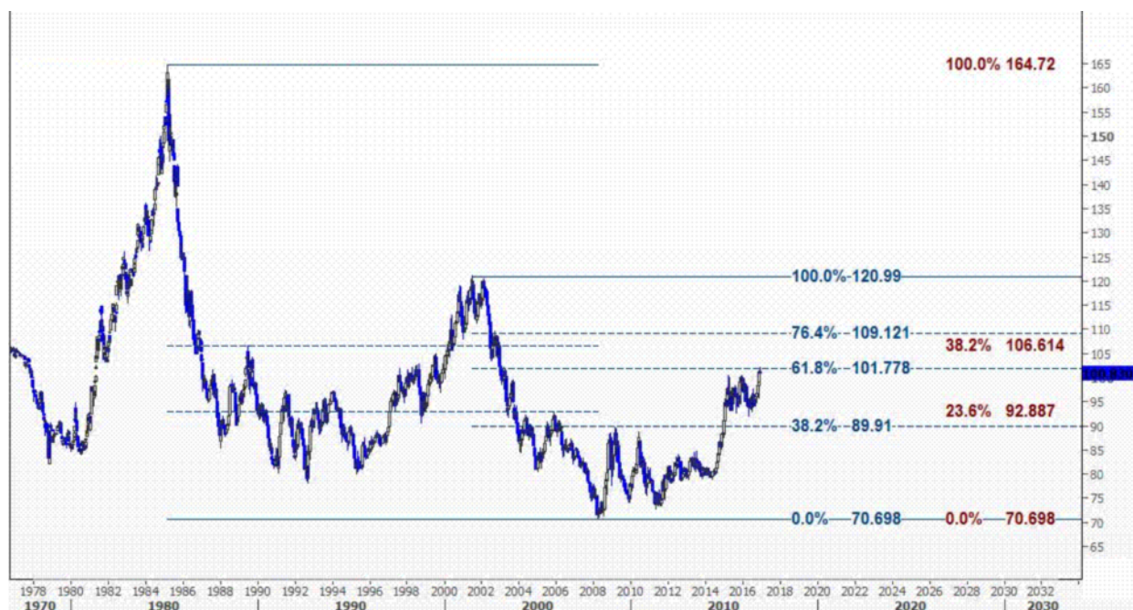
نمودار روند تغییرات تایم فریم هفتگی قیمت جهانی شاخص دلار آمریکا