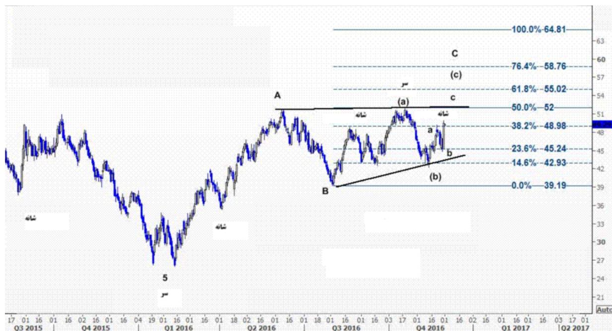
نمودار روند تغییرات تایم روزانه قیمت نفت خام سبک آمریکا

در جلسه دو هفته گذشته عربستان سعودی، ایران و عراق بالاخره توانستند اختلافاتشان را برای تقسیم سهم خود از به دوش کشیدن بار کاهش تولید حل کنند تا این سازمان برای اولین بار پس از ۲۰۰۸ تولید خود را کاهش دهد. قابل ذکر است عربستان پذیرفته است که ایران، به عنوان موردی خاص، بتواند تولید خود را تا ۳.۹ میلیون بشکه در روز افزایش دهد و همچنین این توافق شامل کاهش حدود ۶۰۰.۰۰۰ بشکه نفت در روز توسط کشور های غیر عضو اوپک است و این خبر محرک قابل توجهی برای ادامه ی افزایش قیمت نفت آمریکا و برنت به ترتیب تا سطوح ۵۵.۰۲ و ۵۷.۳۶ دلار در هر بشکه به شمار می رود که پیشتر نیز بدان اشاره کرده بودیم.