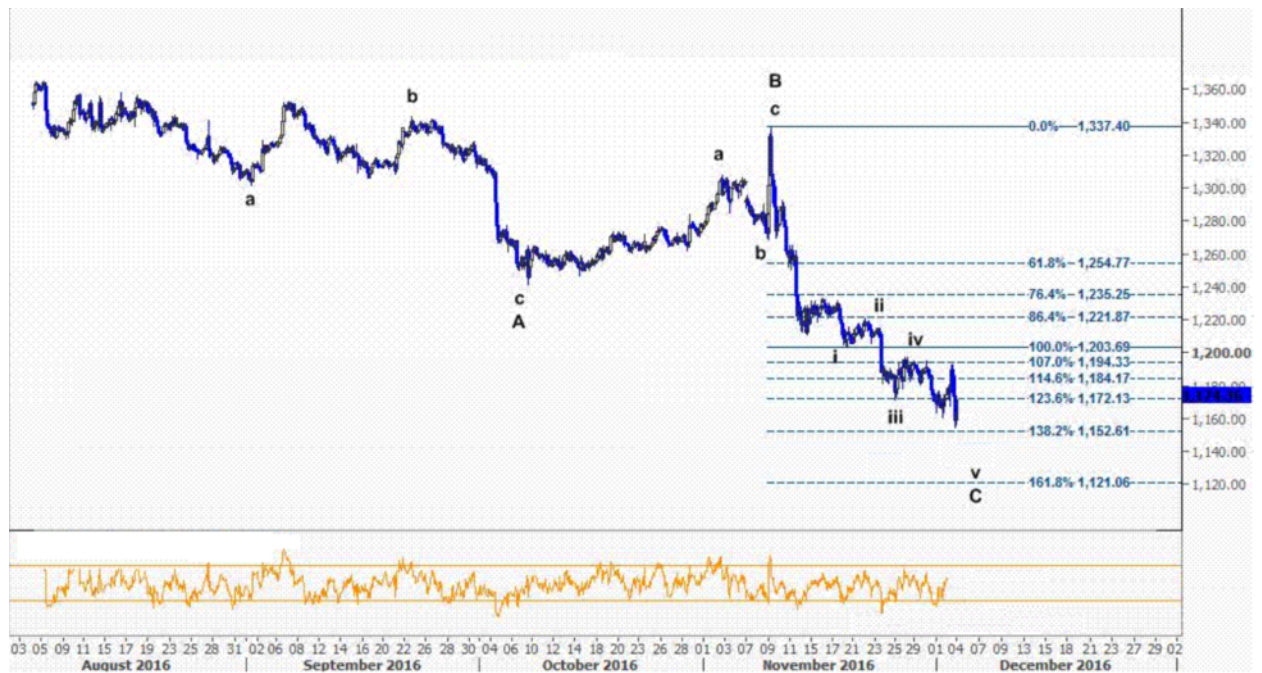
نمودار روند تغییرات تایم فریم روزانه قیمت جهانی اونس طلا