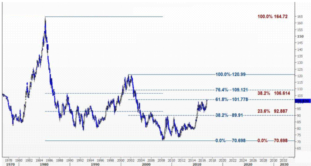
نمودار روند تغییرات تایم فریم هفتگی قیمت جهانی شاخص دلار آمریکا