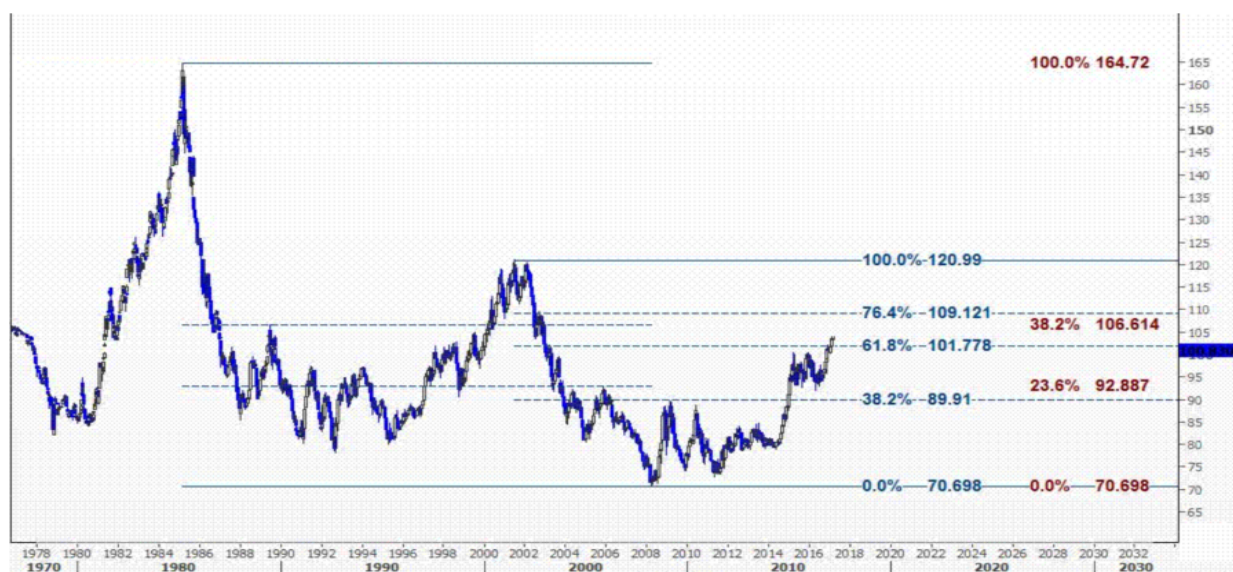
نمودار روند تغییرات تایم فریم هفتگی قیمت جهانی شاخص دلار آمریکا

بنابراین اوضاع یورو در مقابل دلار آمریکا بدلیل واگرایی بوجود آمده بین سیاست های پولی بانک مرکزی اروپا و آمریکا همچنان جالب نیست و هر چند ممکن است بعد از شکسته شدن سطح ۱۰۵۰۰ بازگشت های تکنیکی را از سطح حمایت ۱۰۳۶۵ و ۱۰۳۵۰ شاهد باشیم اما در کل روند این ارز همچنان نزولی است. در نمودار پایین شاخص جهانی دلار آمریکا نیز پیش بینی می شود با توجه به شکسته شدن سطح مقاومت ۱۰۱.۷۷ در سه ماهه اول سال آینده به ترتیب تا هدف های ۱۰۶.۶۱ و ۱۰۹.۱۲ صعود کند که در نمودار پایین مشاهده می فرمایید.