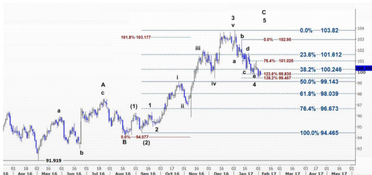
نمودار روند تغییرات تایم فریم روزانه قیمت جهانی شاخص دلار آمریکا

همچنین، تا زمانیکه شاخص دلار آمریکا به روند نزولی خود ادامه دهد، باید در انتظار تقویت ارزش‌های کالایی نظیر دلار استرالیا (AUD)، دلار نیوزلند (NZD)، دلار کانادا (CAD) و حتی یورو بود که قبلاً این حرکت افزایشی را با توجه به بررسی روند رو به رشد شاخص جهانی کالاهای اساسی، سی. آر. بی پیش‌بینی کرده بودیم. نوسانات این هفته بازار بی‌تردید تحت تاثیر حرکات بازارهای سهام و بازار اوراق قرضه و همچنین دستورات رئیس جمهور آمریکا خواهد بود زیرا در تقویم اقتصادی آمریکا، رویدادهای چندانی به غیر از آمار مقدماتی تمایلات مصرف‌کنندگان می‌شمارد آمریکا در روز جمعه زمان بندی نشده است.