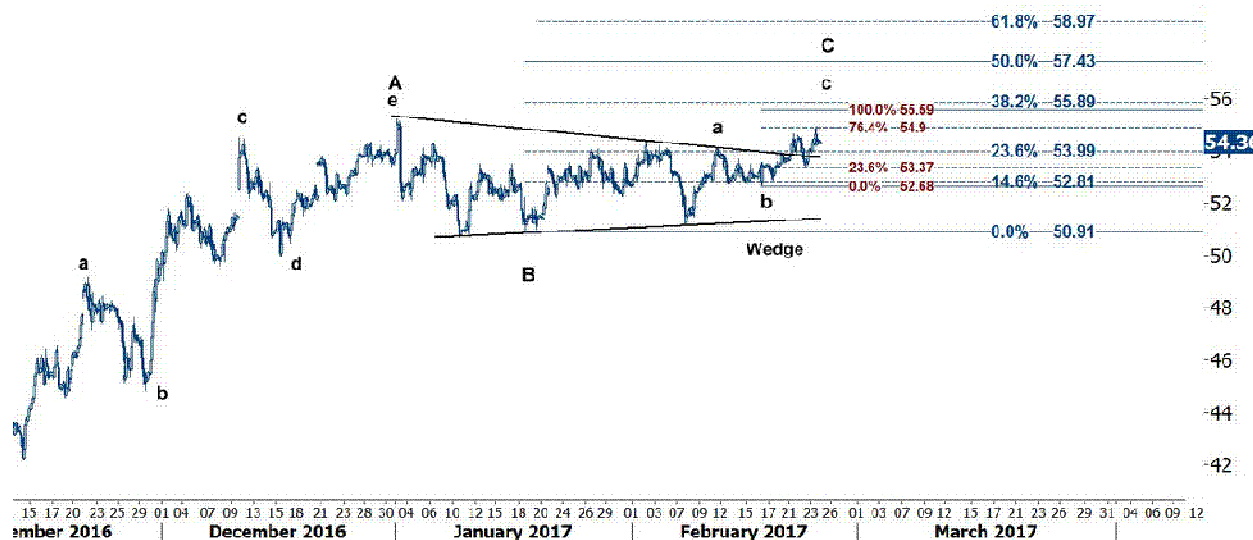
نمودار روند تغییرات تایم فریم ۱ ساعته قیمت نفت برنت دریای شمال لندن