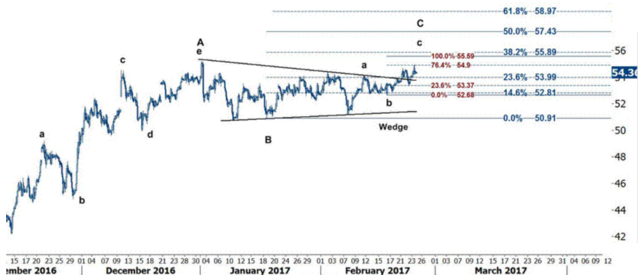
نمودار روند تغییرات تایم فریم ۱ ساعته قیمت نفت برنت دریای شمال لندن