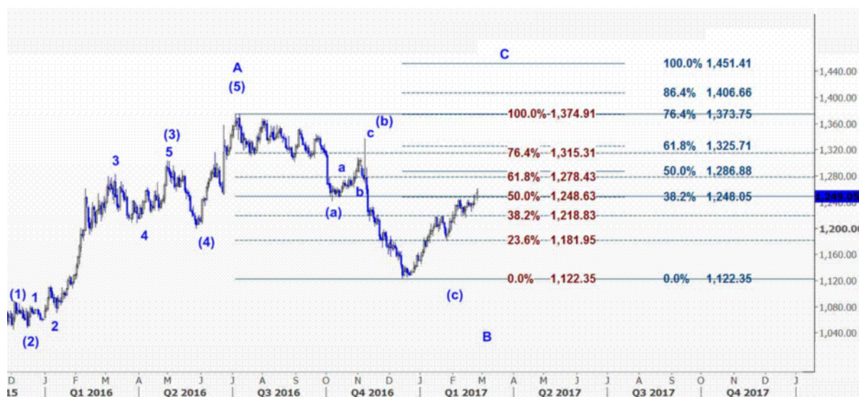
نمودار روند تغییرات تایم فریم روزانه قیمت جهانی اونس طلا

اقتصاددانان زمانی که این شاخص بالای سطح ۵۰ قرار دارد را دوره رونق و توسعه اقتصادی تلقی می کنند و زمانی که شاخص زیر عدد ۵۰ باشد را نشانه رکود و کساد اقتصادی می دانند، عبارتی دیگر عدد ۵۰ مرز روانی اقتصادی برای شاخص مدیریت عرضه کارخانه ای آمریکا (ISM) می باشد. روز پنجشنبه به غیر از آمار معمول مدعیان اولیه بیمه بیکاری هفتگی آمریکا خبر خاصی منتشر نخواهد شد اما روز جمعه توجه اصلی بازار بعد از اعلام آمار مدیریت عرضه بخش خدمات آمریکا (ISM) به سخنرانی چند تن از اعضای بانک مرکزی آمریکا (وانس، پاول، فیشر) و از همه مهمتر سخنرانی یلن رئیس بانک مرکزی آمریکا معطوف خواهد بود.