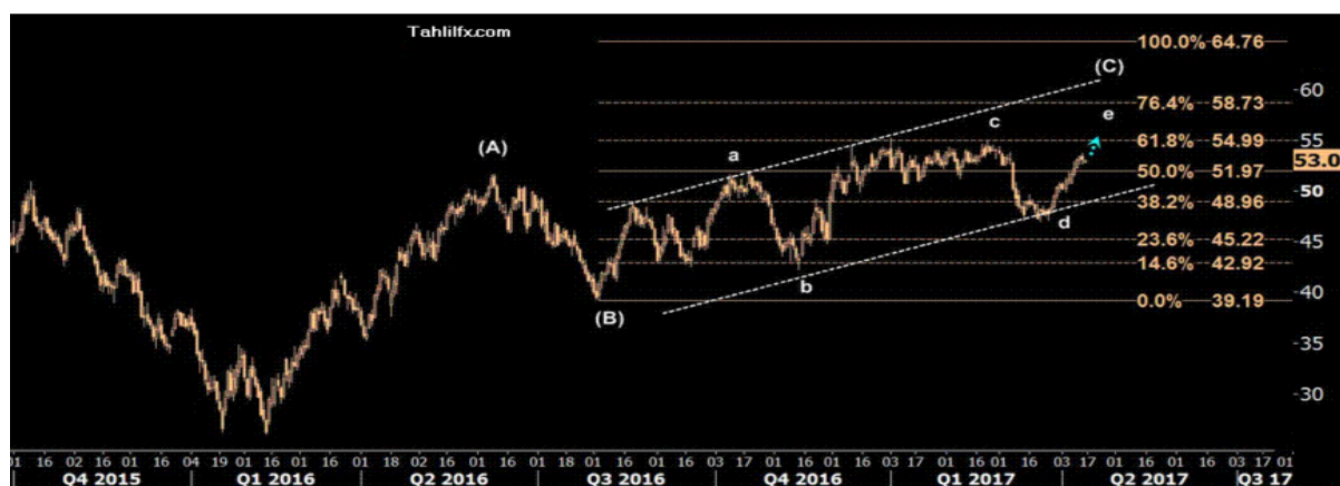
نمودار روند تغییرات تایم فریم ۱ ساعته قیمت نفت برنت دریای شمال لندن