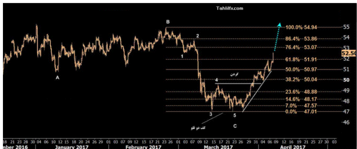
نمودار روند تغییرات تایم فریم روزانه قیمت نفت برنت دریای شمال بازار لندن