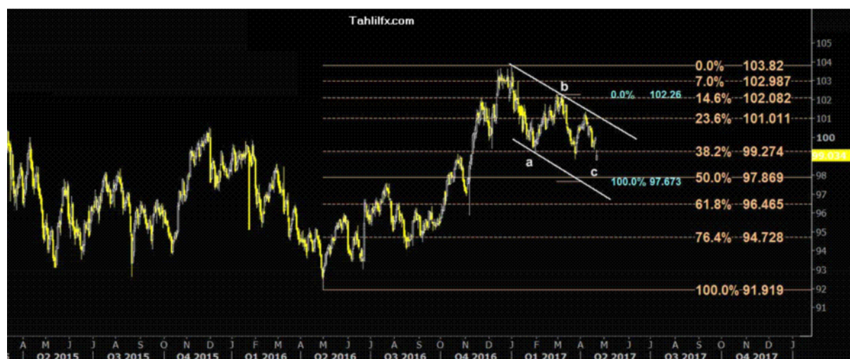
نمودار روند تغییرات تایم فریم روزانه قیمت جهانی شاخص دلار آمریکا

به عبارت دیگر، می توان گفت، در صورتیکه میزان حقوق و دستمزدها افزایش داشته باشد، بانک فدرال برای مقابله با تورم، به افزایش نرخ بهره اقدام خواهد کرد. این هفته در روز جمعه بازار پیش بینی می کند که تعداد اشتغال بخش غیر کشاورزی آمریکا (NFP) در ماه آوریل از رقم قبلی ۹۸۰۰۰ به ۱۸۵۰۰۰، آمار ماهیانه نرخ بیکاری از ۴.۵٪ به ۴.۶٪ و آمار میانگین درآمد نقدی ساعتی از ۰.۲٪ به ۰.۳٪ تغییر یابند. در نمودار زیر، روند احتمالی حرکت آتی قیمت جهانی ایندکس دلار آمریکا و هدف های بعدی آن در کانال رسم شده مشخص شده است: