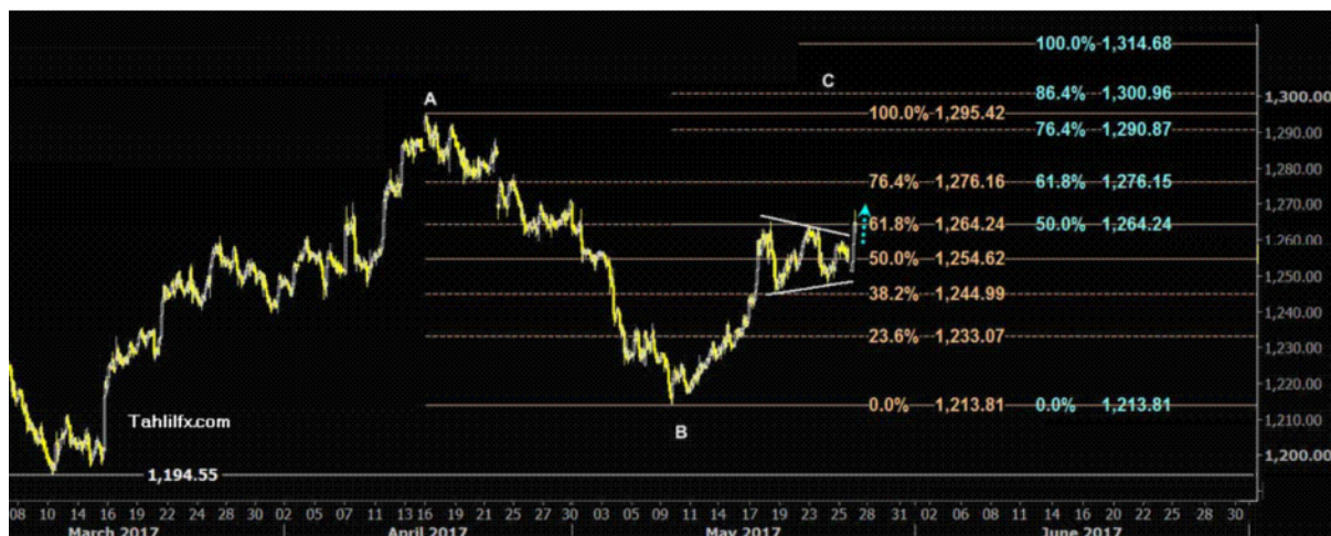
نمودار روند تغییرات تایم فریم ۱ ساعته قیمت جهانی اونس طلا