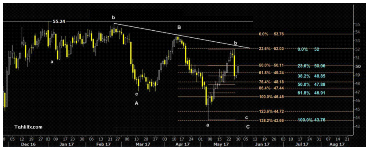
نمودار روند تغییرات تایم فریم ۱ ساعته قیمت نفت برنت دریای شمال بازار لندن