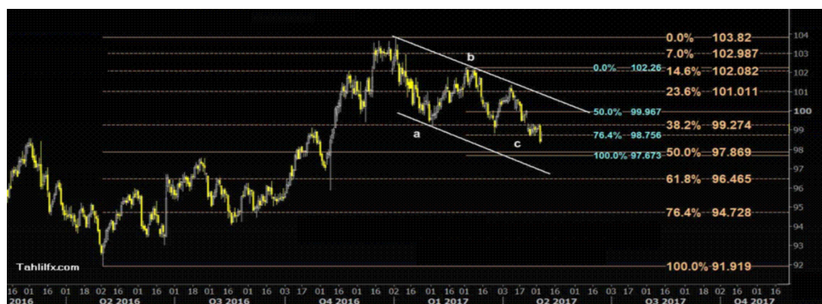
نمودار روند تغییرات تایم فریم روزانه قیمت جهانی شاخص دلار آمریکا

در نمودار شاخص جهانی دلار آمریکا نیز براساس آن چیزی که در چارت تایم فریم روزانه پایین دیده می شود با توجه به آنکه سطح حمایت ۹۸.۷۵ (خط فیبوناچی ۷۶.۴ درصدی) با قدرت شکسته شده است در این هفته زمینه را برای کاهش بیشتر به سوی پایین ترین نرخهای ۱۱ و ۱۰ نوامبر ۲۰۱۶ فراهم آورده است و بعد از آن حمایت چندان مهمی تا سطوح ۹۷.۹۵ و ۹۷.۷۰ وجود ندارد که این سطوح در نزدیکی نرخهای ۹۷.۸۶ (خط فیبوناچی ۵۰ درصدی) و ۹۷.۶۷ (خط فیبوناچی ۱۰۰ درصدی) می باشد که در نمودار زیر مشاهده می فرمائید.