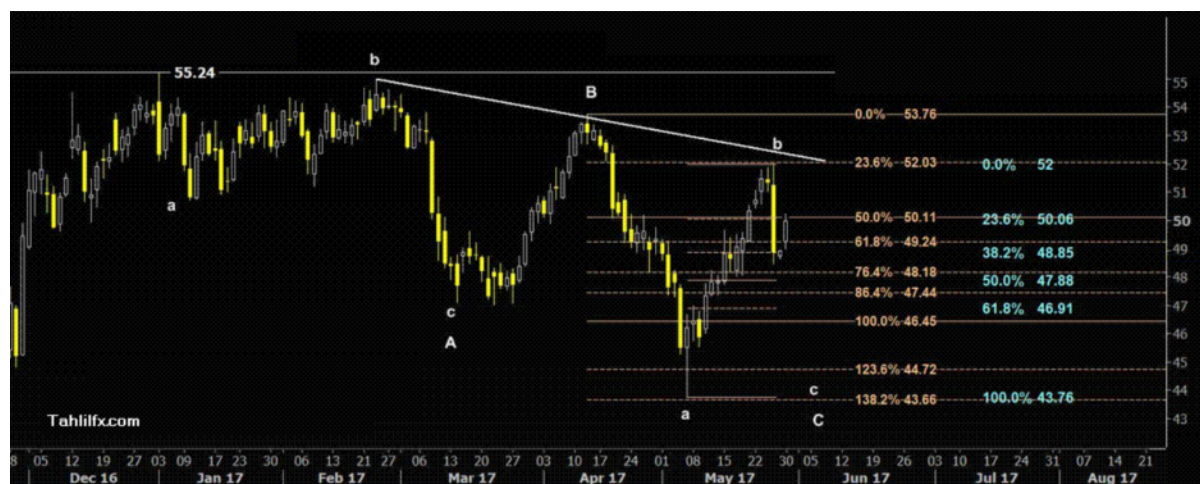
نمودار روند تغییرات تایم فریم ۱ ساعته قیمت نفت برنت دریای شمال بازار لندن