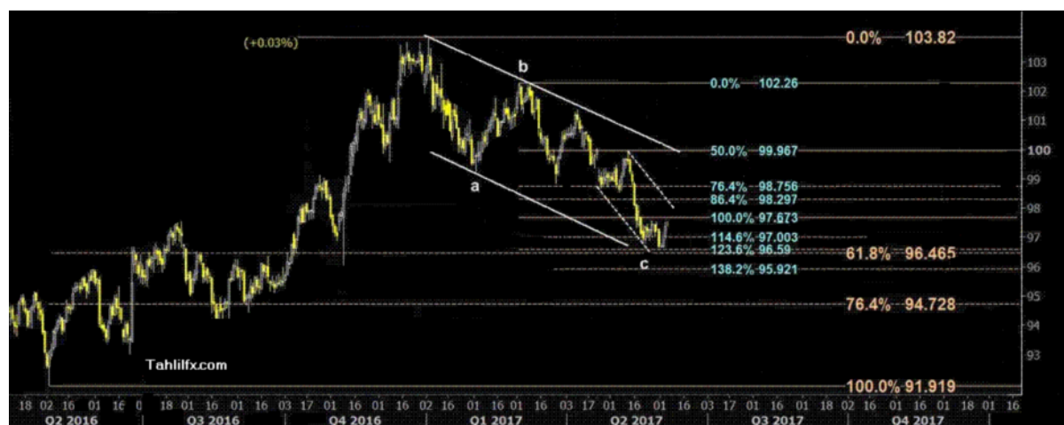
نمودار روند تغییرات تایم فریم روزانه قیمت جهانی شاخص دلار آمریکا

لازم به ذکر است برای این هفته تا قبل از جلسه بانک مرکزی آمریکا انتظار اخبار نسبتاً مهمی را داریم، شاخص قیمت تولیدکنندگان، قیمت مصرف کنندگان، خرده فروشی آمریکا خبرهایی هستند که بازار قطعاً به آنها توجه خواهد کرد. آمار مجوز ساختمان سازی و شروع خانه سازی و تمایلات مصرف کنندگان میثیگان آمریکا نیز روز جمعه اعلام خواهند شد.