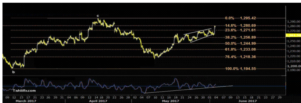
نمودار روند تغییرات تایم فریم ۱ ساعته قیمت جهانی اونس طلا