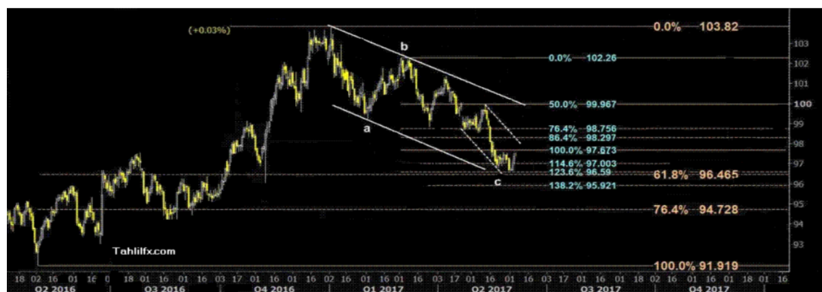
نمودار روند تغییرات تایم فریم روزانه قیمت جهانی شاخص دلار آمریکا

لازم به ذکر است برای این هفته تا قبل از جلسه بانک مرکزی آمریکا انتظار اخبار نسبتاً مهمی را داریم، شاخص قیمت تولیدکنندگان، قیمت مصرف کنندگان، خرده فروشی آمریکا خبرهایی هستند که بازار قطعاً به آنها توجه خواهد کرد. آمار مجوز ساختمان سازی و شروع خانه سازی و تمایلات مصرف کنندگان میثیگان آمریکا نیز روز جمعه اعلام خواهند شد.