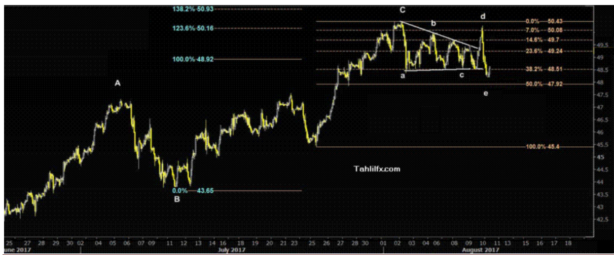
نمودار روند تغییرات تایم فریم ۱ ساعته قیمت نفت خام سبک آمریکا

باید توجه داشت معامله گران نفت همچنان به دقت تنش ها بین آمریکا و کره شمالی و تاثیرات آن بر بازارهای مختلف را رصد می کنند که این تحولات به دلیل تشدید جریان ریسک گریزی تاثیر منفی بر قیمت داراییهای پرریسک نظیر سهام و کالاها و نفت در کوتاه مدت خواهد داشت. بنابراین در نمودار زیر تا زمانی که قیمت نفت خام سبک آمریکا پایین سطوح مقاومت ۴۸.۹۲ و ۴۹.۲۴ دلار در هر بشکه قرار گرفته است، روند احتمالی حرکت آتی و هدف کاهشی بعدی آن در چارت پایین مشخص شده است.