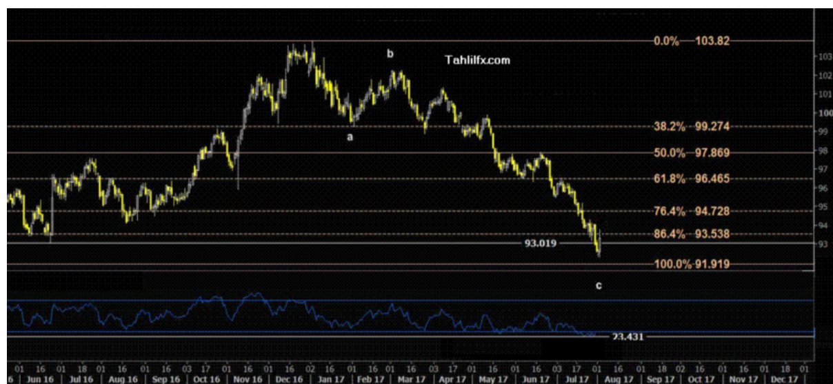
نمودار روند تغییرات تایم فریم روزانه قیمت جهانی شاخص دلار آمریکا

باید توجه داشت واحدهای پولی که در شاخص دلار آمریکا وجود دارند عبارتند از یورو ۵۷.۶٪، ین ژاپن ۱۳.۶٪، پوند انگلیس ۱۱.۹٪، دلار کانادا ۹.۱٪، کرون سوئد ۴.۲٪ و فرانک سوئیس ۳.۶٪. این شاخص یکی از مهم ترین شاخص های بازار در جهت گیری روند قیمت محسوب می شود بطوری که هر موقع این شاخص روند صعودی به خود بگیرد، ارزشهای سایر کشورها در مقابل دلار آمریکا تضعیف شده و به فروش می روند و هر موقع که این شاخص روند نزولی داشته باشد، ارزشهای سایر کشورها در مقابل دلار آمریکا قوی تر می شوند و خریداری می شوند. از این رو ارزشهای سایر کشورها وابستگی شدید به شاخص جهانی دلار آمریکا دارند.