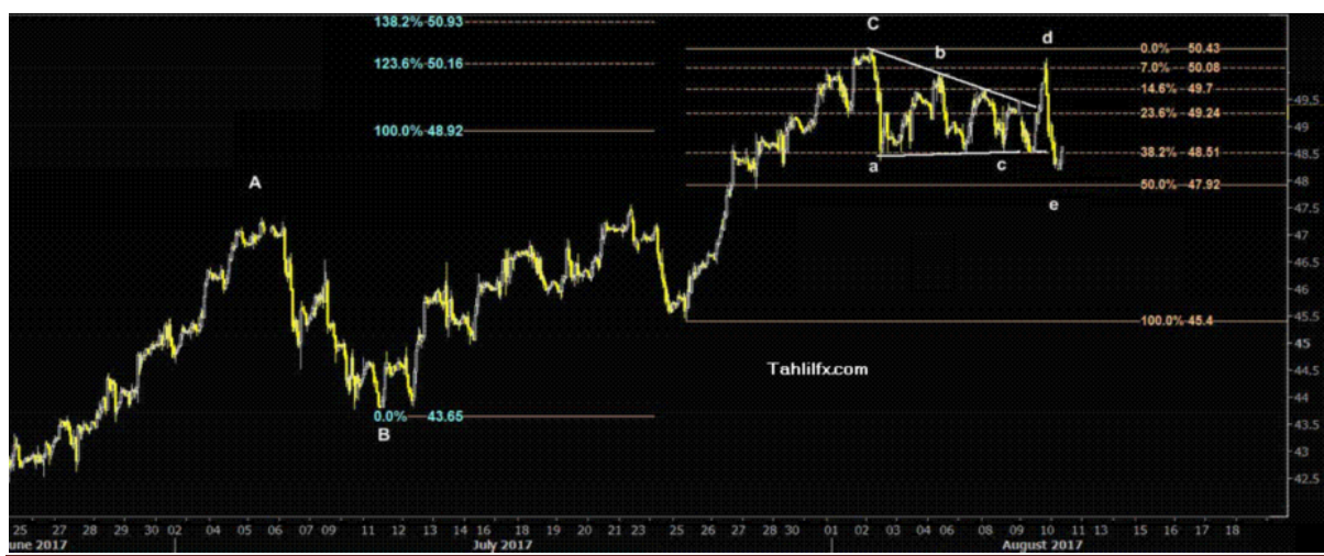
نمودار روند تغییرات تایم فریم ۱ ساعته قیمت نفت خام سبک آمریکا

باید توجه داشت معامله گران نفت همچنان به دقت تنش ها بین آمریکا و کره شمالی و تاثیرات آن بر بازارهای مختلف را رصد می کنند که این تحولات به دلیل تشدید جریان ریسک گریزی تاثیر منفی بر قیمت داراییهای پرریسک نظیر سهام و کالاها و نفت در کوتاه مدت خواهد داشت. بنابراین در نمودار زیر تا زمانی که قیمت نفت خام سبک آمریکا پایین سطوح مقاومت ۴۸.۹۲ و ۴۹.۲۴ دلار در هر بشکه قرار گرفته است، روند احتمالی حرکت آتی و هدف کاهشی بعدی آن در چارت پایین مشخص شده است.