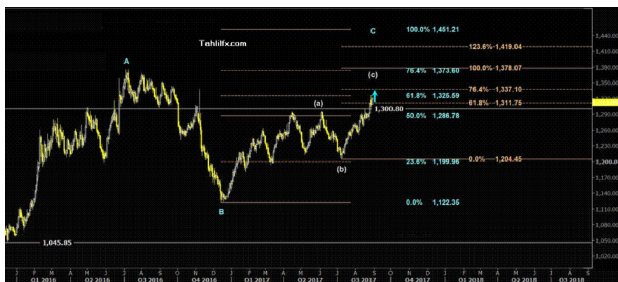
نمودار روند تغییرات تایم فریم روزانه قیمت جهانی اونس طلا

این مسئله نکات مهمی دارد که با توجه به اینکه در هفته ای بسر می بریم که اخبار چندان مهمی را انتظار نداریم (به غیر از سخنرانی برینارد، کاشکاری، کاپلن، دادلی، هارکر از اعضای بانک مرکزی آمریکا و شاخص موسسه مدیریت عرضه خدمات آمریکا (ISM) اهمیت آن بیشتر نیز می شود چون معمولاً در این روزها بازار متاثر از اخبار روزهای قبل رفتار خواهد کرد به عبارتی به هضم آنها مشغول می شود.