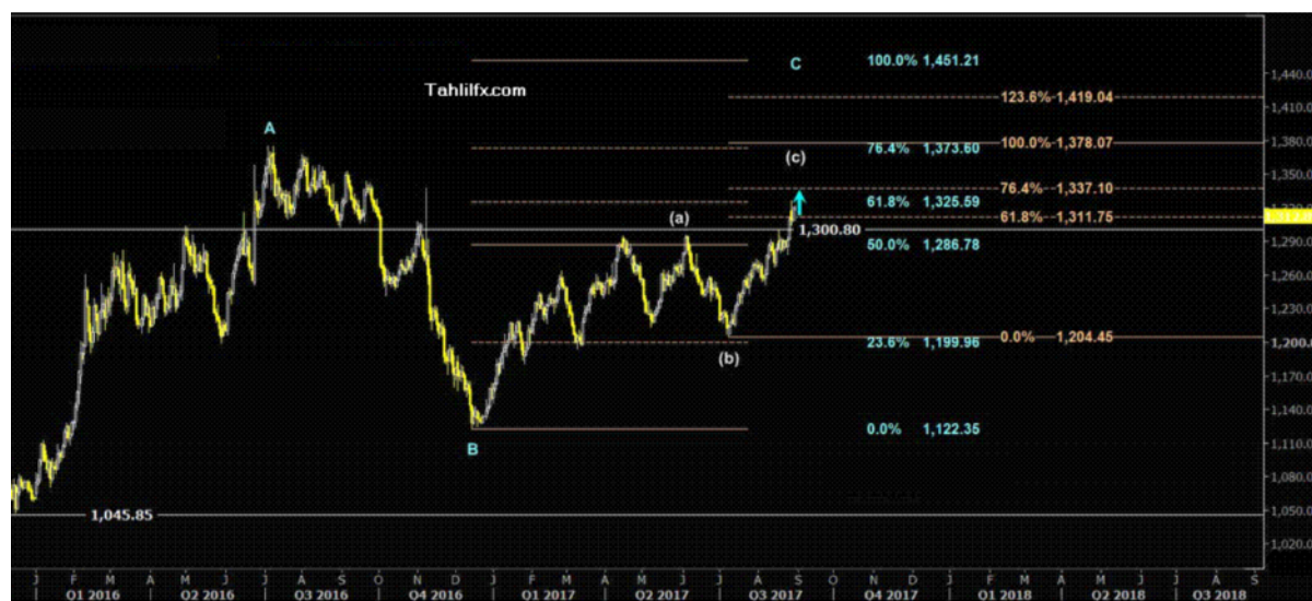
نمودار روند تغییرات تایم فریم روزانه قیمت جهانی اونس طلا

این مسئله نکات مهمی دارد که با توجه به اینکه در هفته ای بسر می بریم که اخبار چندان مهمی را انتظار نداریم (به غیر از سخنرانی برینارد، کاشکاری، کاپلن، دادلی، هارکر از اعضای بانک مرکزی آمریکا و شاخص موسسه مدیریت عرضه خدمات آمریکا (ISM) اهمیت آن بیشتر نیز می شود چون معمولاً در این روزها بازار متاثر از اخبار روزهای قبل رفتار خواهد کرد به عبارتی به هضم آنها مشغول می شود.