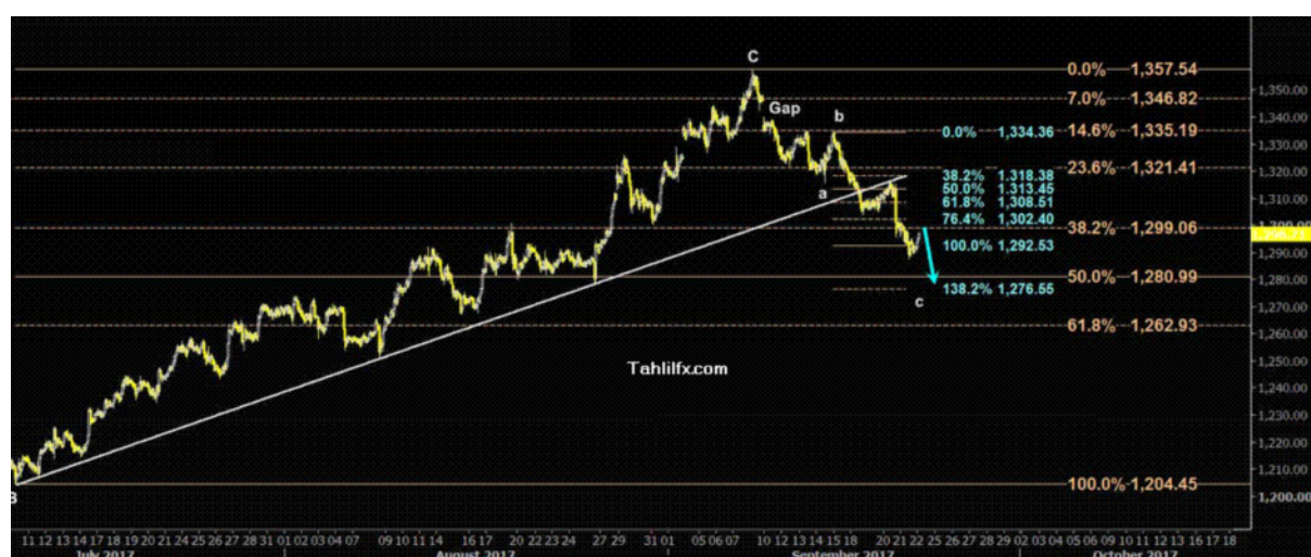
نمودار روند تغییرات تایم فریم ۱ ساعته قیمت جهانی اونس طلا

از آنجایی که تصمیم گیری هفته گذشته در مورد نرخ بهره بانک مرکزی آمریکا به اتفاق آرا بوده است و در بیانیه بانک مرکزی آمریکا به افزایش یک مرحله نرخ بهره در ماه دسامبر سال جاری و سه مرحله افزایش دیگر در سال آینده اشاره گردید، انتظار کاهش قیمت جهانی اونس طلا به ترتیب به سطوح ۱۲۸۰ و ۱۲۷۶ وجود دارد. در تقویم اقتصادی این هفته، سخنرانی های متعددی از اعضای بانک مرکزی آمریکا به چشم می خورد که در میان آنها سخنرانی دادلی، اوانس، برینارد، فیشر، هاگر و از همه مهمتر یلن می تواند تعیین کننده جهت وضعیت اقتصادی ایالات متحده آمریکا و مباحث مرتبط با افزایش نرخ بهره بانک مرکزی آمریکا باشد.