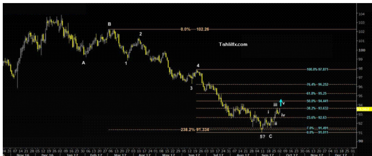
نمودار روند تغییرات تایم فریم ماهیانه قیمت جهانی شاخص دلار آمریکا