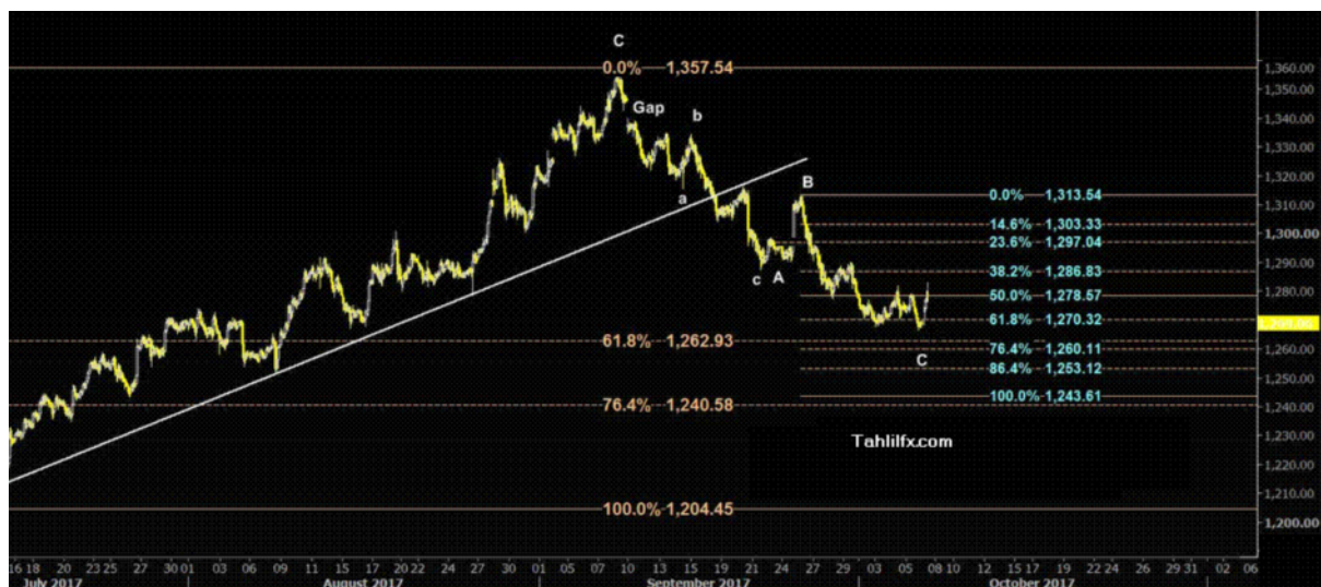
نمودار روند تغییرات تایم فریم ۱ ساعته قیمت جهانی اونس طلا