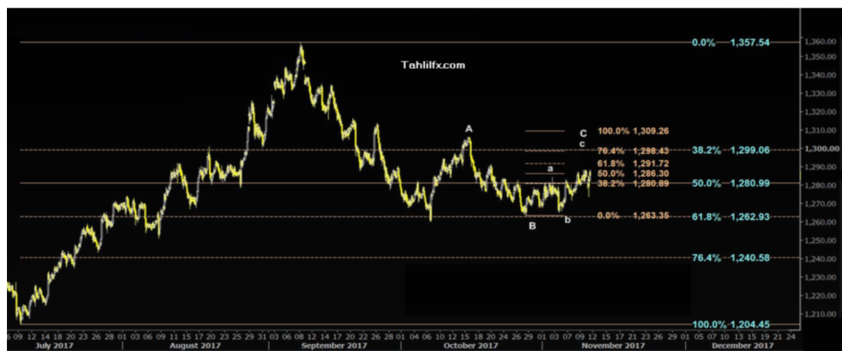
نمودار روند تغییرات تایم فریم ۱ ساعته قیمت جهانی اونس طلا