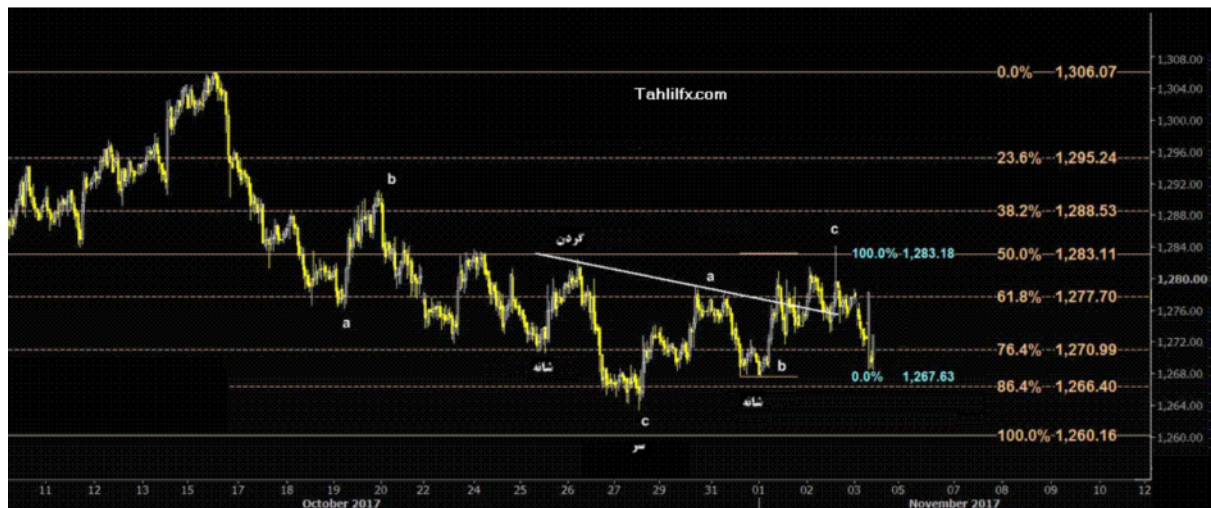
نمودار روند تغییرات تایم فریم روزانه قیمت جهانی اونس طلا