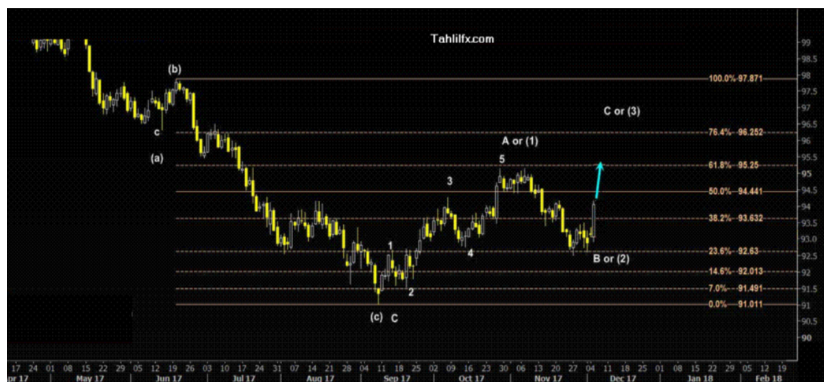
نمودار روند تغییرات تایم فریم روزانه قیمت جهانی شاخص دلار آمریکا

باید توجه داشت واحدهای پولی که در شاخص دلار آمریکا وجود دارند عبارتند از یورو ۵۷.۶٪، ین ژاپن ۱۳.۶٪، پوند انگلیس ۱۱.۹٪، دلار کانادا ۹.۱٪، کرون سوئد ۴.۲٪ و فرانک سوئیس ۳.۶٪. این شاخص یکی از مهم ترین شاخص های بازار در جهت گیری روند قیمت محسوب می شود بطوری که هر موقع این شاخص همانند پیش بینی این هفته روند افزایشی به خود بگیرد، ارزشهای سایر کشورها در مقابل دلار آمریکا تضعیف شده و فروخته می شوند و هر موقع این شاخص روند کاهشی داشته باشد، ارزشهای سایر کشورها در مقابل دلار آمریکا تقویت می شوند و خریداری می شوند. از این رو ارزشهای سایر کشورها وابستگی شدید به شاخص جهانی دلار آمریکا دارند. از منظر تحلیل تکنیکال این روند افزایشی قیمت دلار آمریکا از سطح ۹۱.۰۱۱ به ۹۵.۱۴۹ (بالاترین سطح ۷ نوامبر ۲۰۱۷) در قالب پنج موج شکل گرفته است و موج چهارم یعنی موج ۴ در نزدیکی سطح ۹۲.۶۳ به پایان رسیده است و با توجه به برخورد قیمت به سطح حمایت ۹۲.۶۳ احتمال افزایش قیمت آن در موج بزرگ C وجود دارد. در حرکت صعودی با توجه به شکست سطح مقاومت ۹۳.۶۳۲ تارگت افزایشی بعدی بر روی ۹۴.۴۴۱ و ۹۵.۲۵ قرار دارند و این در حالی است که در حرکت نزولی تنها شکست سطح ۹۳.۶۳۲ که حالا تبدیل به حمایت شده است و تثبیت کندل روزانه قیمت در پایین آن منجر به کاهش قیمت آن به سطوح ۹۲.۶۳ و ۹۲.۰۱۳ می شود.