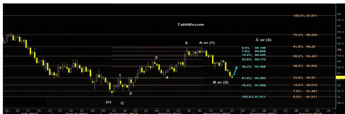
نمودار روند تغییرات تایم فریم روزانه قیمت جهانی شاخص دلار آمریکا

همانطور که در چارت پایین دیده می شود این سطح حمایت ۹۲.۵۹ در نزدیکی سطح حمایت دیگری در نرخ ۹۲.۶۳ یعنی جاییکه خط فیبوناچی ریتریسمنت ۲۳.۶ درصدی از روند نزولی ۹۷.۸۷۱ (بالا ترین سطح ۲۰ ژوئن ۲۰۱۷) رسم شده است قرار دارد و این دو سطح حمایت به احتمال زیاد در ماه جاری مانع از کاهش بیشتر شاخص جهانی دلار آمریکا خواهند شد و همین امر باعث تشکیل حرکت اصلاحی و افزایشی به سوی سطح ۹۳.۵۶۸ می گردد که در چارت پایین مشاهده می فرمائید. لازم به ذکر است در حرکت نزولی تنها بسته شدن قیمت در پایین سطح حمایت ۹۲.۵۹ می تواند سناریوی افزایشی به سطح ۹۳.۵۶۸ را نقض کند و به کاهش بیشتر قیمت به سطح حمایت بعدی ۹۱.۹۸۸ منجر شود که این سطح بر روی خط فیبوناچی ریتریسمنت ۷۶.۴ درصدی تشکیل شده است. در این ماه اخبار مهمی از جمله گزارش اشتغال ماهانه بخش غیر کشاورزی آمریکا (NFP) منتشر خواهد شد و بازارها در انتظار نوسانات مختلفی هستند که این خبر می تواند بوجود آورد.