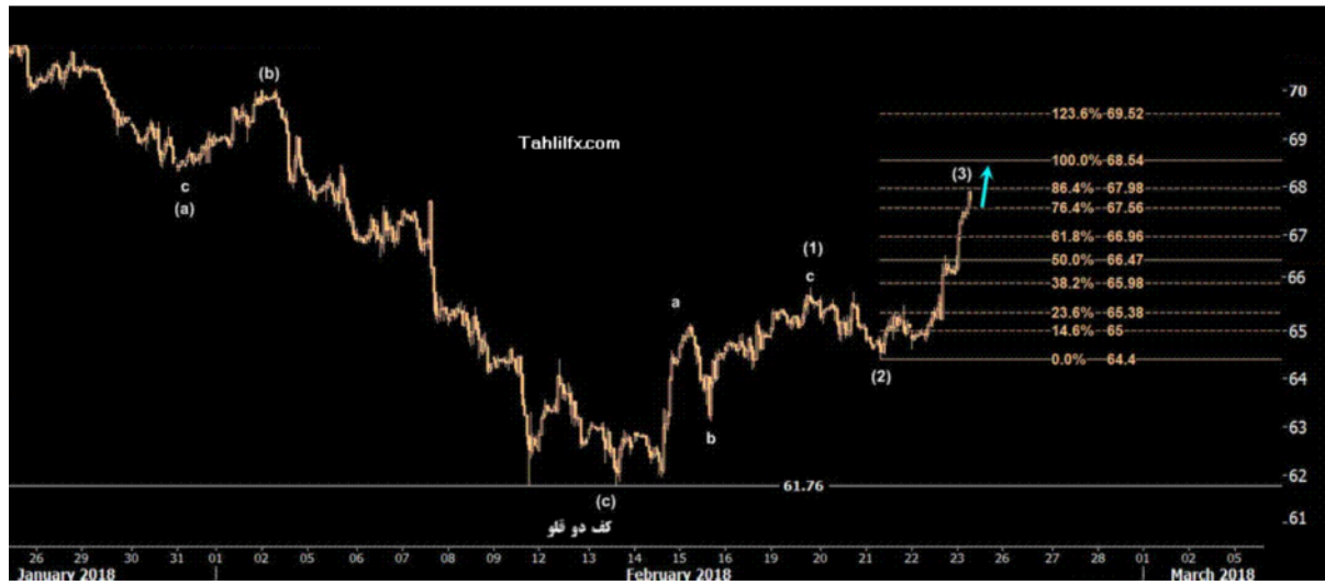
نمودار روند تغییرات تایم فریم روزانه قیمت نفت برنت دریای شمال لندن