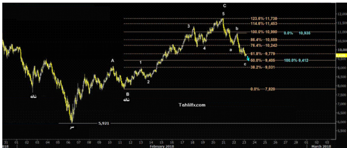
نمودار روند تغییرات تایم فریم روزانه قیمت جهانی شاخص دلار آمریکا