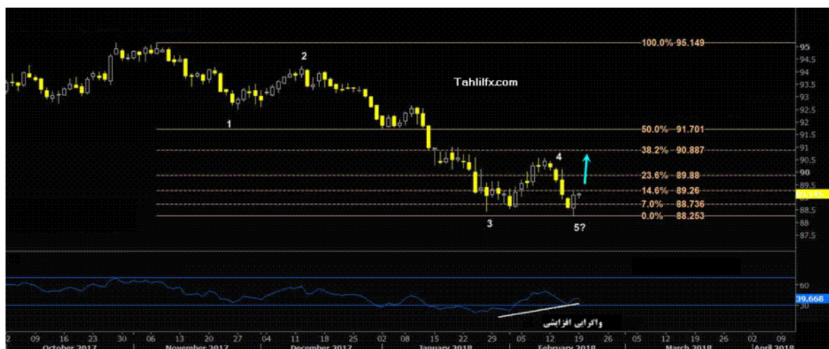
نمودار روند تغییرات تایم فریم روزانه قیمت جهانی شاخص دلار آمریکا