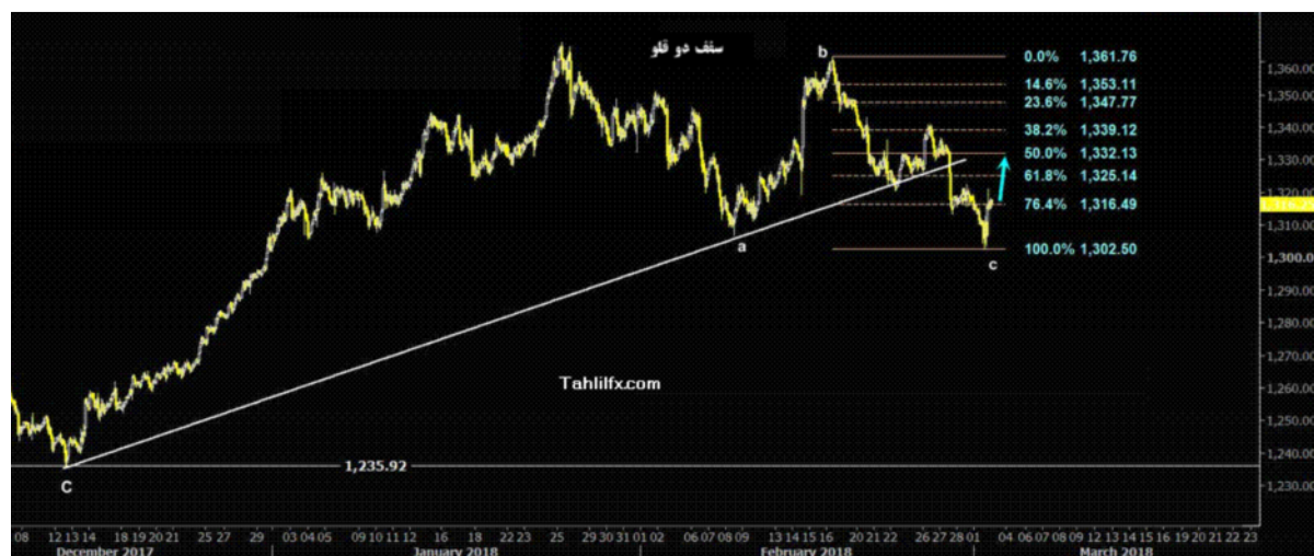
نمودار روند تغییرات تایم فریم ۱ ساعته قیمت جهانی اونس طلا