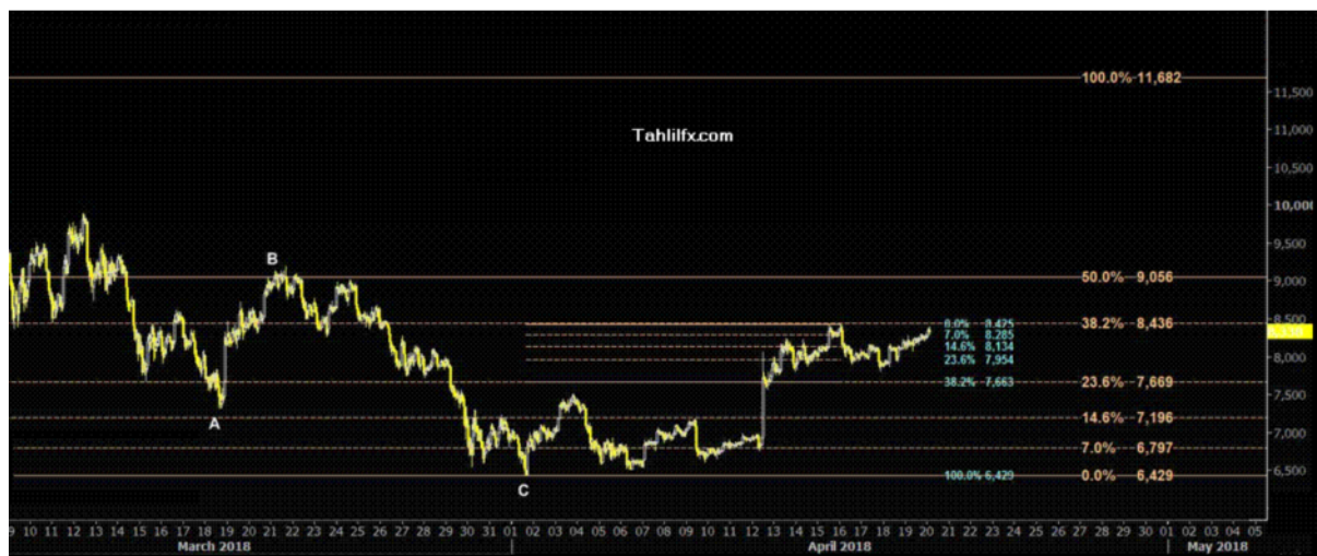
نمودار روند تغییرات تایم فریم روزانه قیمت جهانی شاخص دلار آمریکا