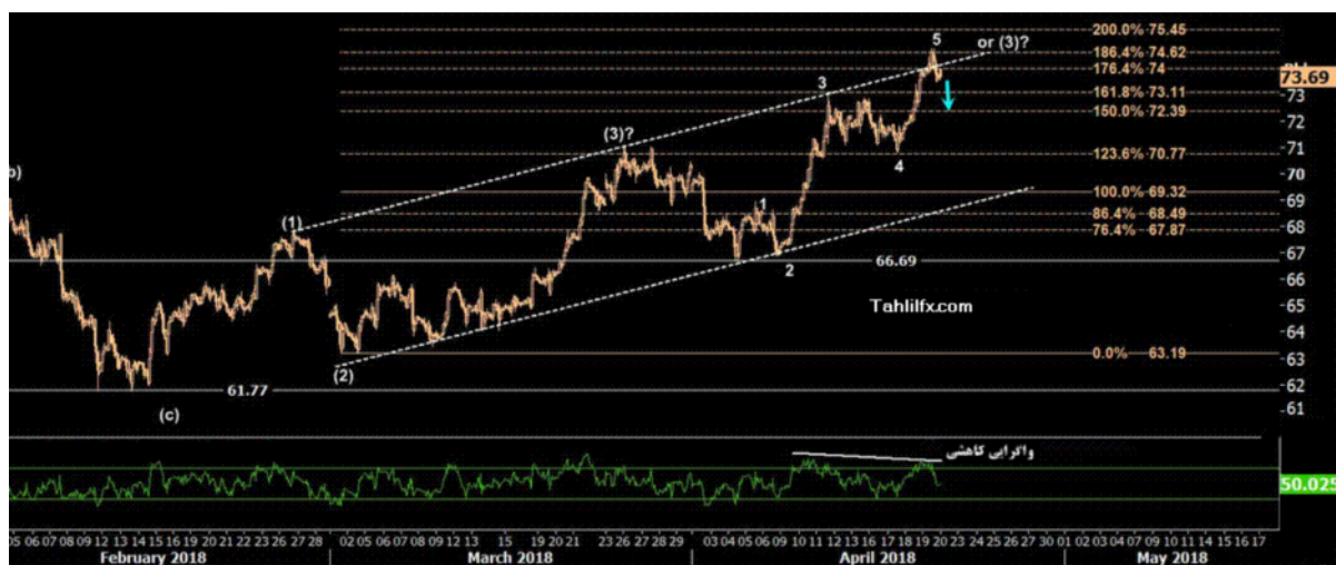
نمودار روند تغییرات تایم فریم روزانه قیمت نفت برنت دریای شمال لندن