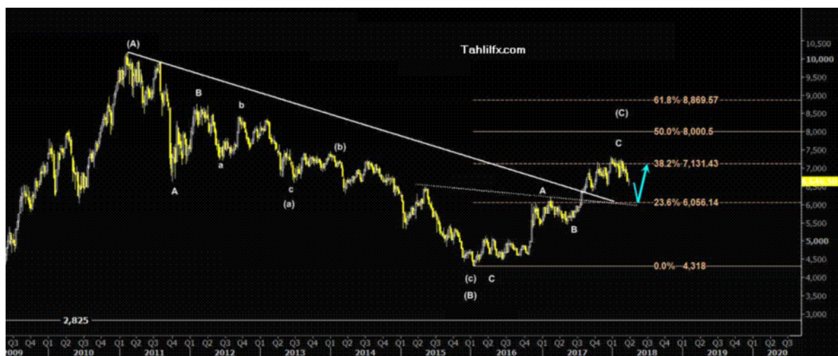
نمودار روند تغییرات تایم فریم هفتگی قیمت جهانی هر تن آلومینیم آلیاژی در بازار بورس فلزات لندن