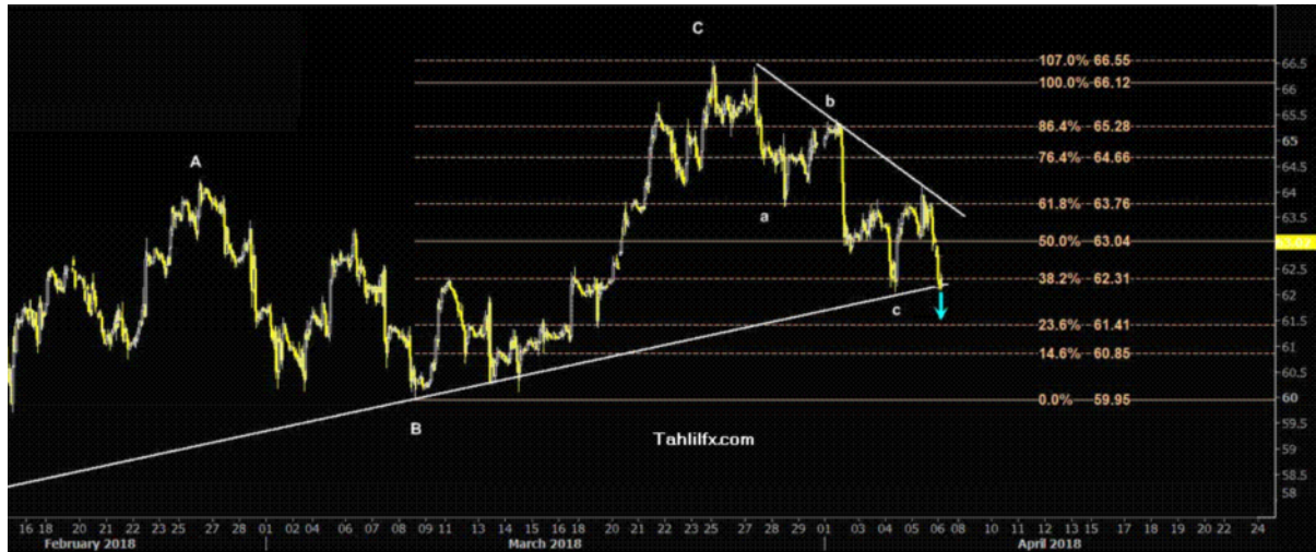
نمودار روند تغییرات تایم فریم ۱ ساعته قیمت نفت برنت دریای شمال لندن