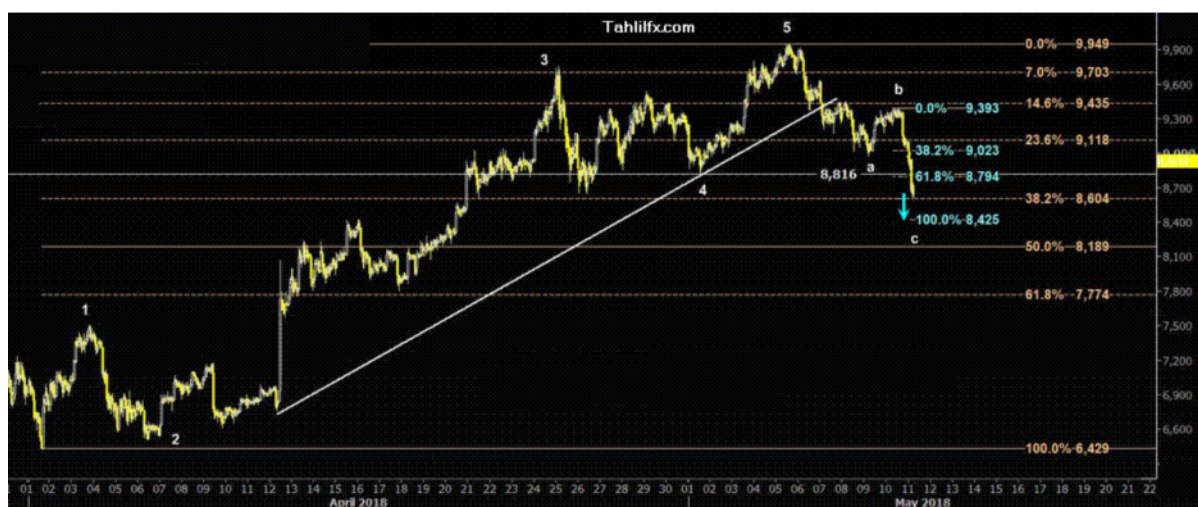
نمودار روند تغییرات تایم فریم روزانه قیمت جهانی شاخص دلار آمریکا