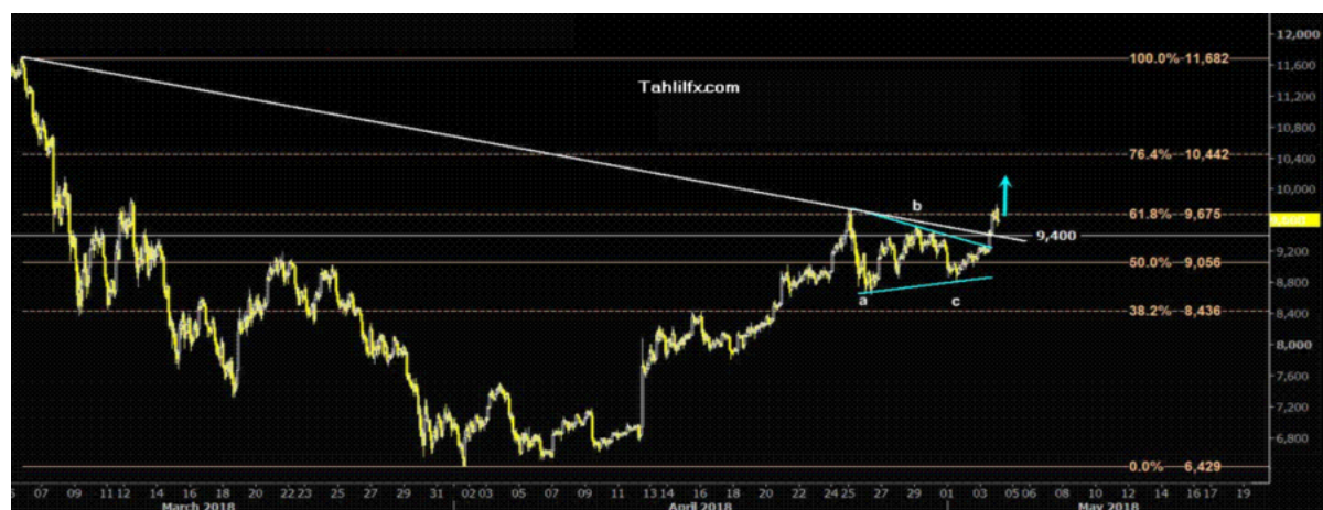
نمودار روند تغییرات تایم فریم ۱ ساعته قیمت جهانی بیت کوین

همچنین بیت کوین یک نوع ارز دیجیتال است که به صورت مجازی ساخته و نگهداری می شود. کسی آن را کنترل نمی کند، چاپ نمی شود و به وسیله نرم افزارهای رایانه ای که در سراسر جهان مشغول حل مسائل ریاضی هستند، تولید می شود. در نمودار زیر، روند احتمالی حرکت آتی قیمت بیت کوین و هدف بعدی آن مشخص شده است.