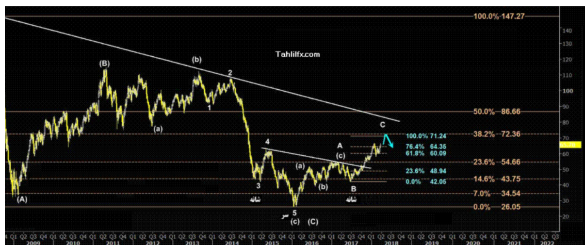
نمودار روند تغییرات تایم فریم روزانه قیمت نفت خام سبک آمریکا

در صورتیکه این سطح حمایت با قدرت شکسته شود و کندل روزانه پایین آن بسته شود تنها منجر به کاهش کوتاه و محدود قیمت نفت برنت دریای شمال به نزدیکی سطح حمایت ۶۳.۶۷ دلار در هر بشکه خواهد شد که در چارت روزانه مشاهده می فرمائید.