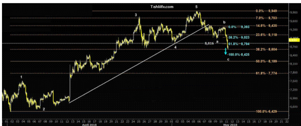
نمودار روند تغییرات تایم فریم روزانه قیمت جهانی شاخص دلار آمریکا